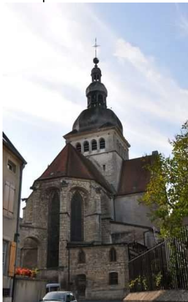
Basilique de Gray