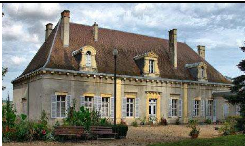
Le Musée Baron Martin