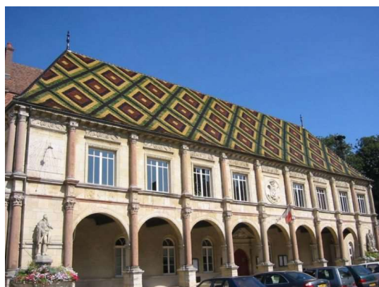
Hôtel de ville

L'Hôtel de ville et ses tuiles vernies. Comme dit la chanson locale (sur l'air du cantique détourné à Marie...) : « C'est le toit d'la Mairie – C'est le toit le plus beau – et ses tuiles vernies – s'apprêtent à r'cevoir de l'eau ! »