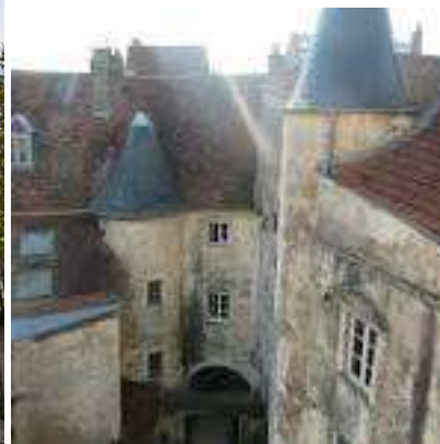
Tour St Pierre Fourier

La Basilique « Notre Dame de Gray » : XVème siècle – Gothique Renaissance