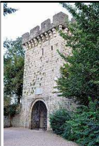
La Tour du Château